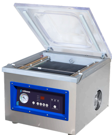
VAKSIC-20 2A E