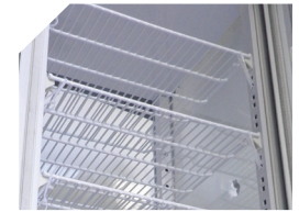
Estantes regulables en altura e iluminación LED.