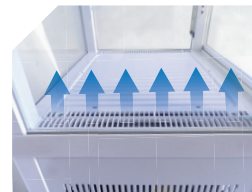
Vitrina refrigerada con desescarche automático